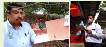
Revisión de trampa