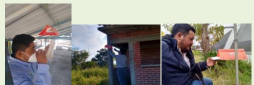
Revisión de trampa