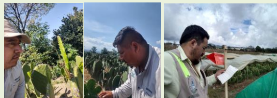
Área de Exploración, Parcela Centinela y Revisión de trampa